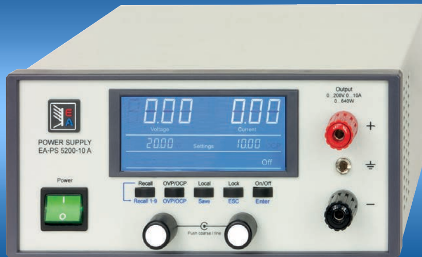
EA-PS 5200-10 A